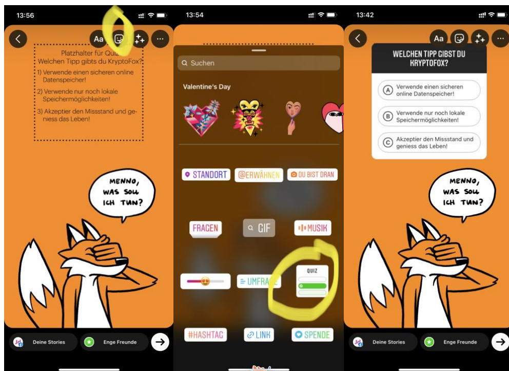
Abbildung 1: Zum erstellen eines Quiz in einer Instagram Story folgende Schritte ausüben → Bild hochladen, Auf das quadratische (gelbmarkierte) Smiley klicken, Quiz auswählen, Text des Vorlagenbildes übertragen